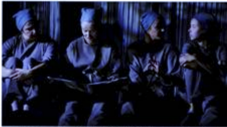
Les premières d'une production tournée qui va se structurer et faire évoluer à mesure qu'on va jouer pendant la première partie de la journée. Théâtre des Halles

C e mercredi 30 mars après-midi se déroulera la journée Pass'Arts, un atelier mis en place par le Théâtre des Halles. En collaboration avec le Grete, organisme qui développe l'éducation artistique et la présence du théâtre contemporain auprès des jeunes, et la Garance, scène nationale de Cavallon, des élèves de seconde à la terminale du lycée Mistral travailleront autour de la pièce "Les filles aux mains jaunes" de Michel Bellefleur, mise en scène par Joëlle Catino. "Les filles aux mains jaunes", les obusettes, les canaris, ainsi nommait-on les femmes qui manipulaient le TNT, pendant la fabrication d'explosifs destinés à alimenter les armes de leurs hommes partis au front. Quatre femmes témoignent de leur quotidien. Tandis que la guerre fait des ravages, elles en subissent également les redoutables